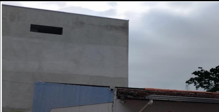
Descrição dos serviços

Faltam rufos e pingadeiras nas platibandas, motivo pelo qual as paredes estão sendo avariadas pela umidade.