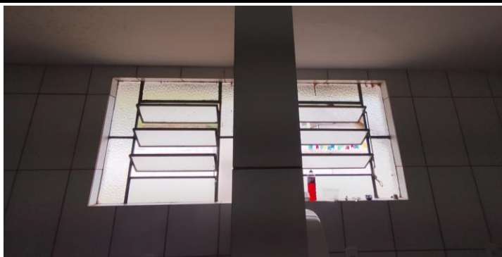
Descrição dos serviços

Iluminação e ventilação da cozinha insuficientes, deverá ser complementada com uso de exaustão mecânica.