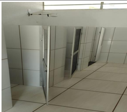
Descrição dos serviços

Portas dos banheiros danificadas, confeccionadas em acrílico flexível.