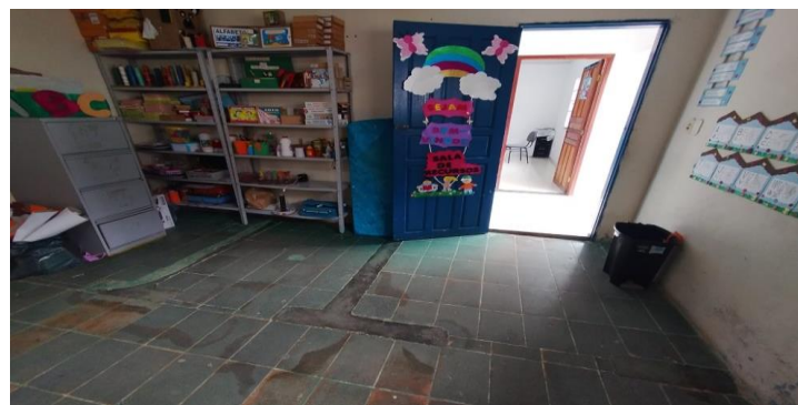
Descrição dos serviços

Piso inadequado da sala de recursos, apresenta irregularidades e desnível na porta de acesso.