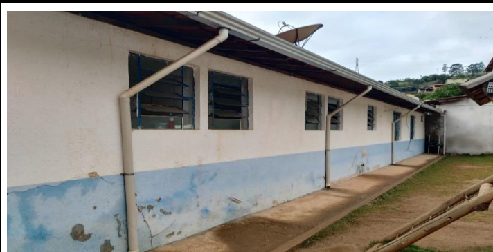
Descrição dos serviços

Janelas da cozinha e despensa sem tela mosquiteiro, pinturas da área externa danificadas.