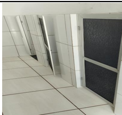
Descrição dos serviços

Portas dos banheiros danificadas, confeccionadas em acrílico flexível.