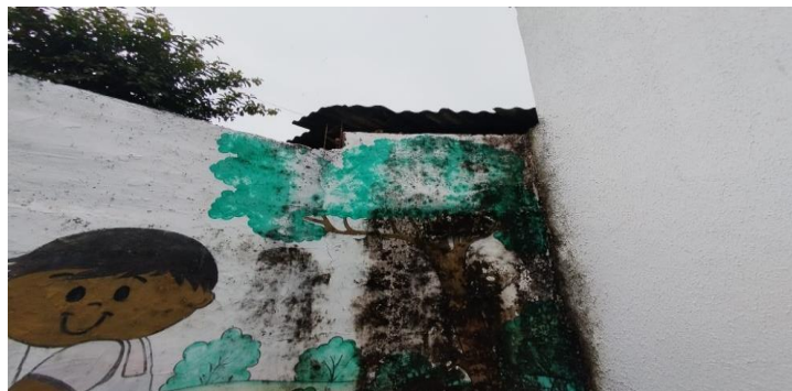
Descrição dos serviços