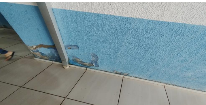
Descrição dos serviços