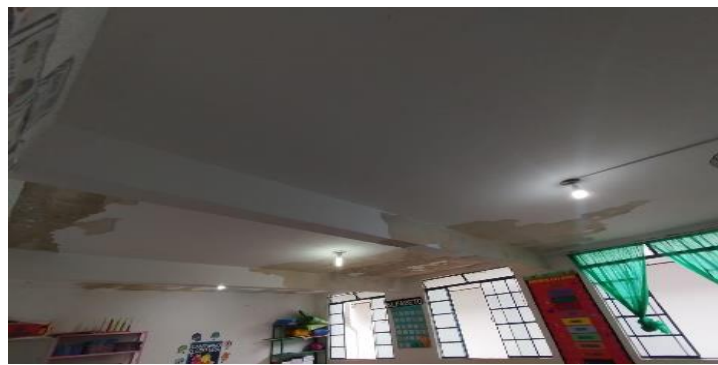
Descrição dos serviços

Descamação de teto das sala de aula, janela emperradas e com vidros quebrados.