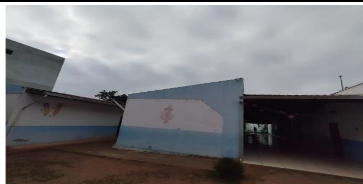
Descrição dos serviços

Faltam rufos e pingadeiras nas platibandas, motivo pelo qual as paredes estão sendo avariadas pela umidade.