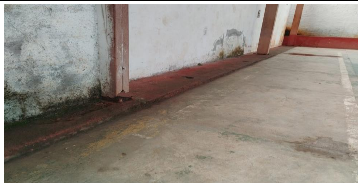
Descrição dos serviços

Base dos pilares metálicos da quadra com estrutura comprometida. Foi observado corrosão nos pilares, parafusos/chumbadores e chapa base.