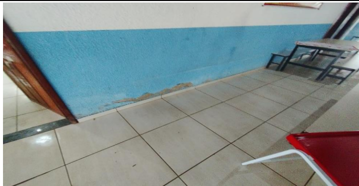
Descrição dos serviços