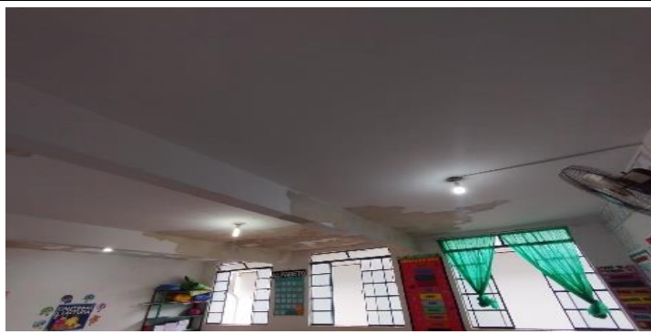
Descrição dos serviços

Descamação de teto das sala de aula, janela emperradas e com vidros quebrados.