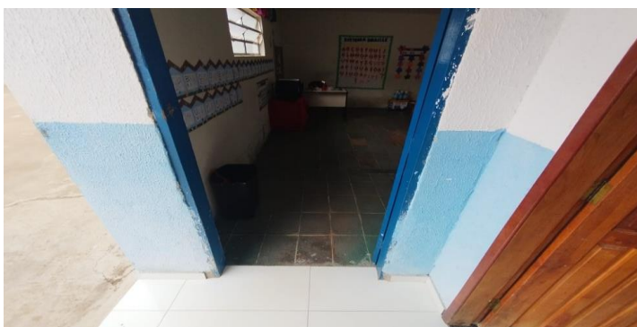
Descrição dos serviços

Piso inadequado da sala de recursos, apresenta irregularidades e desnível na porta de acesso.