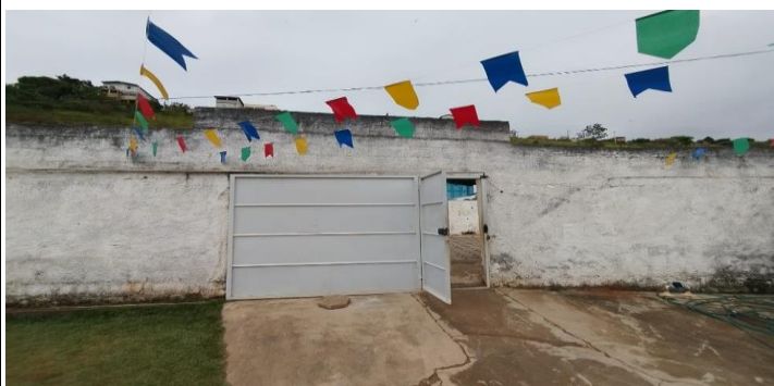
Descrição dos serviços

Pinturas do muro de fechamento deterioradas.