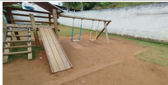
Descrição dos serviços

Antiga caixa de areia (substituir por pavimento de concreto).