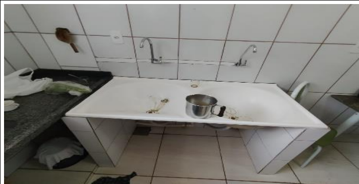
Descrição dos serviços

Tanque indevidamente implantado na cozinha, será substituído por pia industrial.