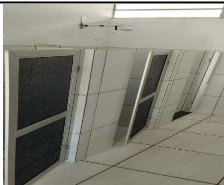
Descrição dos serviços

Portas dos banheiros danificadas, confeccionadas em acrílico flexível.