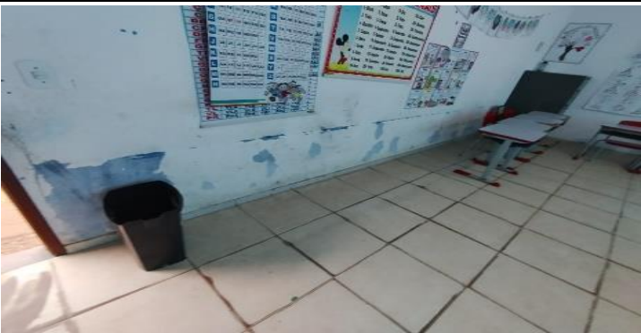
Descrição dos serviços