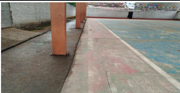
Descrição dos serviços

Base dos pilares metálicos da quadra com estrutura comprometida. Foi observado corrosão nos pilares, parafusos/chumbadores e chapa base.